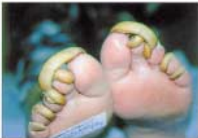
Onychogryphosis, ausgeprägte Mißbildung der Nägel.