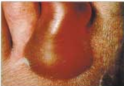
Diabetische Blasen (Bullosum diabeticorum).