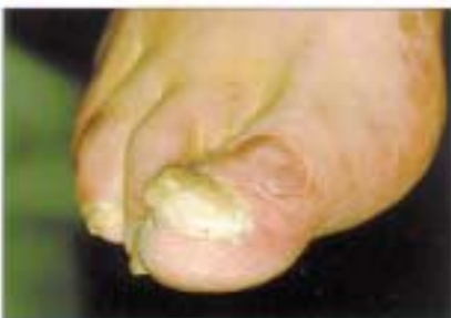
Onychia, hypertrophische Nägel mit subungualer Hyperkeratose.