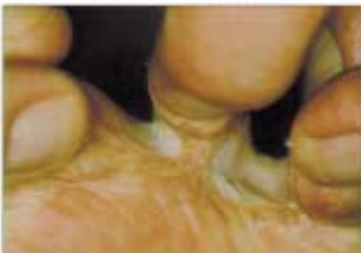
Pilzinfektion zwischen den Zehen.